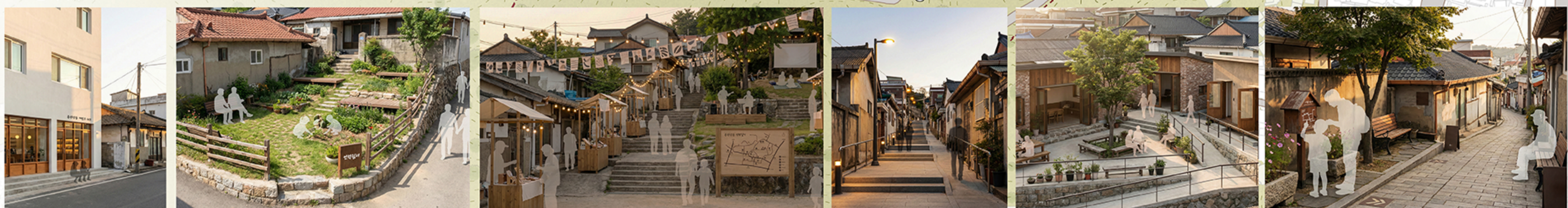
새로 지은 커먼스 허브와 오래된 주택이 공존하는 골목의 풍경 / 버려진 모서리공간과 골짜기 채워져, 잠시 숲 고르는 동네 작은 언덕방 / 계단 골목을 따라 공연-체움-로컬 상점이 이어지는 언덕 마을 축제와 저녁 / 금사골 골목에 개단 경사로나 손잡이와 가로등을 더해, 누구나 오르기 편한 길로 정비할 모습 / 숙박용과 공유주방이 중심을 둘러싼 언덕 스테이 허브, 경사로와 벤치 사이로 관광객과 주민이 함께 요리하고 있는 마을 가정 / 포장과 벤치, 안내 표지로 정비된 메인 골목길, 언덕 산책이 시작되는 최